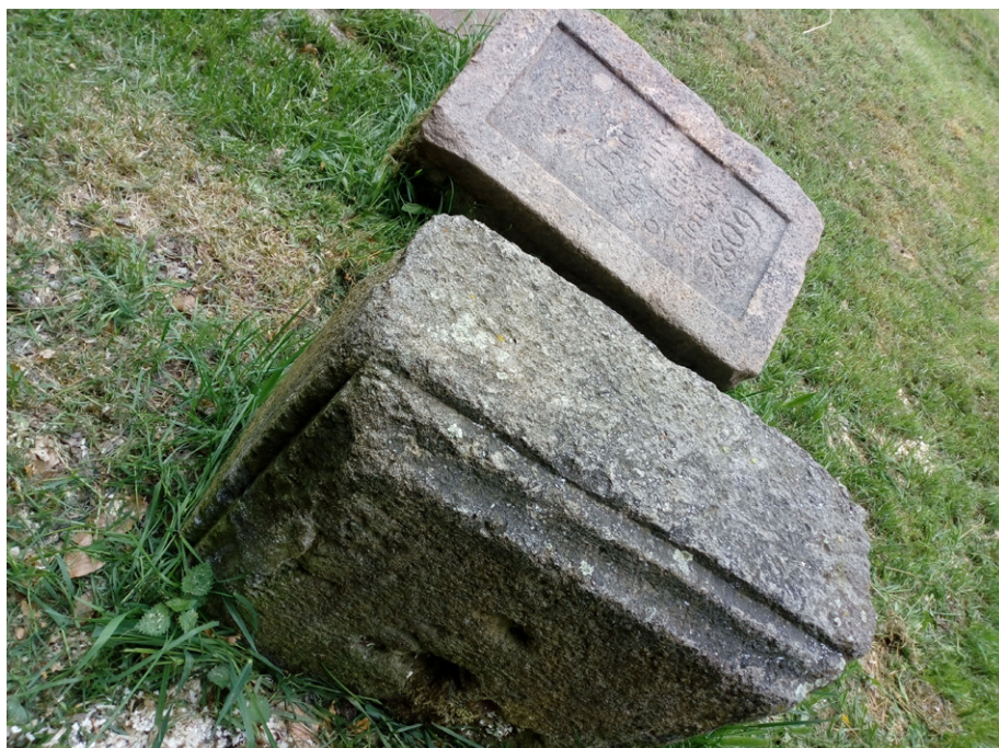
Dvě zachráněné části pomníku Františkem Soukupem, podstavec a sloupek s nápisem.