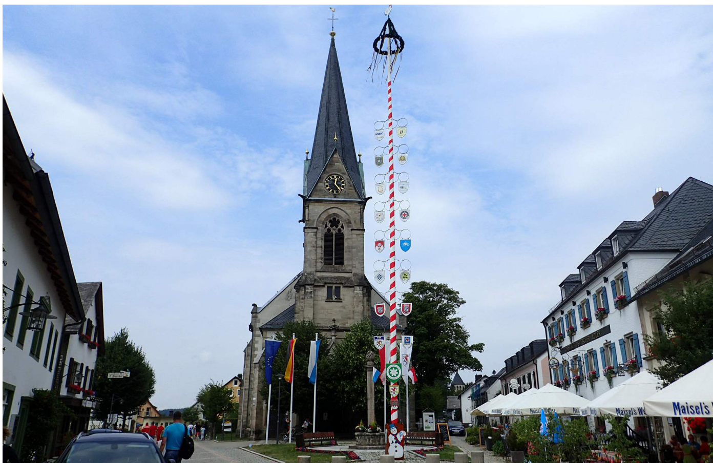
Návštěva Bischofsgrünu 22. 7. na slavnostech města.

KRÁSNOOČKO 2/2018*Vyšlo 30. července 2018 ročník VI, číslo 1*Zdarma*Registrováno pod evidenčním číslem MK ČR E 18846*